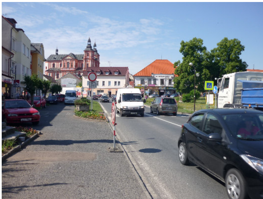
Přeštice – náměstí