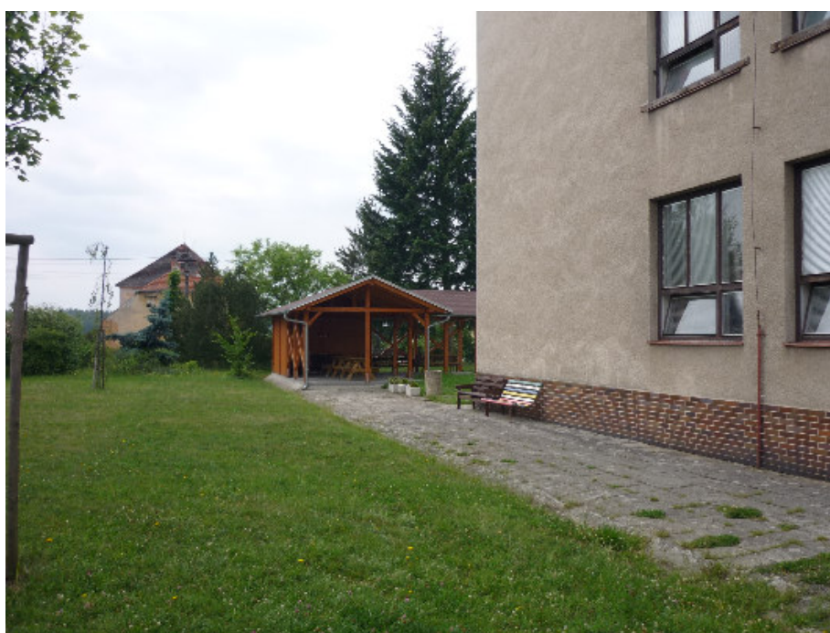
Chlumčany – přístřešek v areálu školy