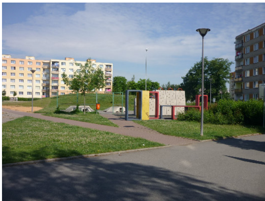
Přeštice – vnitroblok