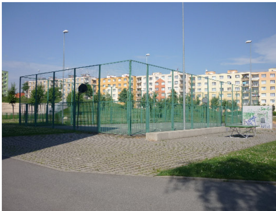
Přeštice – vnitroblok