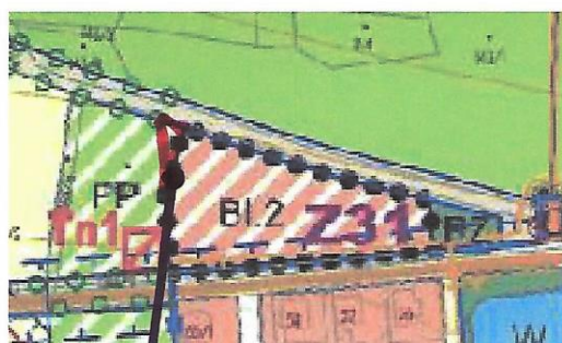
Rozšíření zastavit. plochy